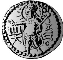
Monnaie Kushana, représentation de Miros

UN DISPOSITIF ÉDITORIAL THÉMATIQUE. — Autour d'un thème ou d'une problématique, chaque numéro de MEI « Médiation et information » est composé de trois parties. La première est consacrée à un entretien avec les acteurs du domaine abordé. La seconde est composée d'une dizaine d'articles de recherche. La troisième présente la synthèse des travaux de jeunes chercheurs.